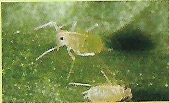
Hama kutu daun ( myzus persicae )